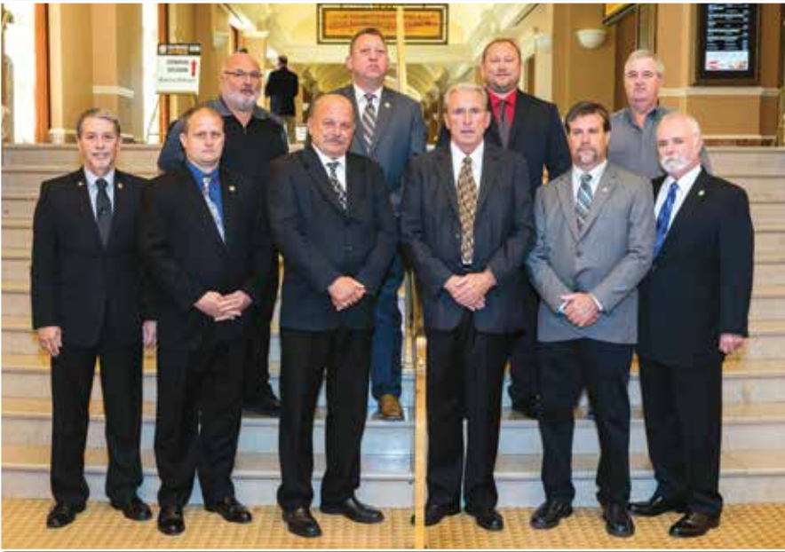
COMITÉ DE CREDENCIALES