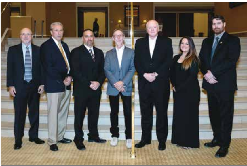
COMITÉ DE RITUAL E HISTORIA DE LA HERMANDAD