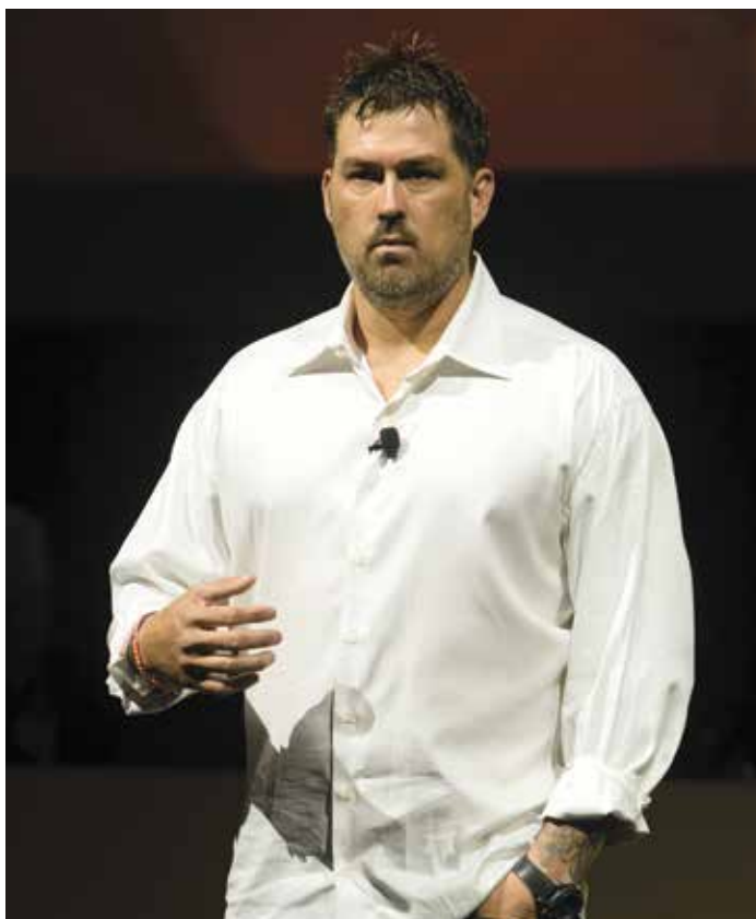
MARCUS LUTTRELL Infante de la Marina de EE.UU. retirado