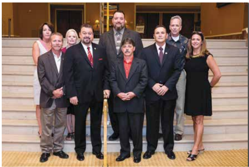
COMITÉ DE INFORME DE DIRIGENTES