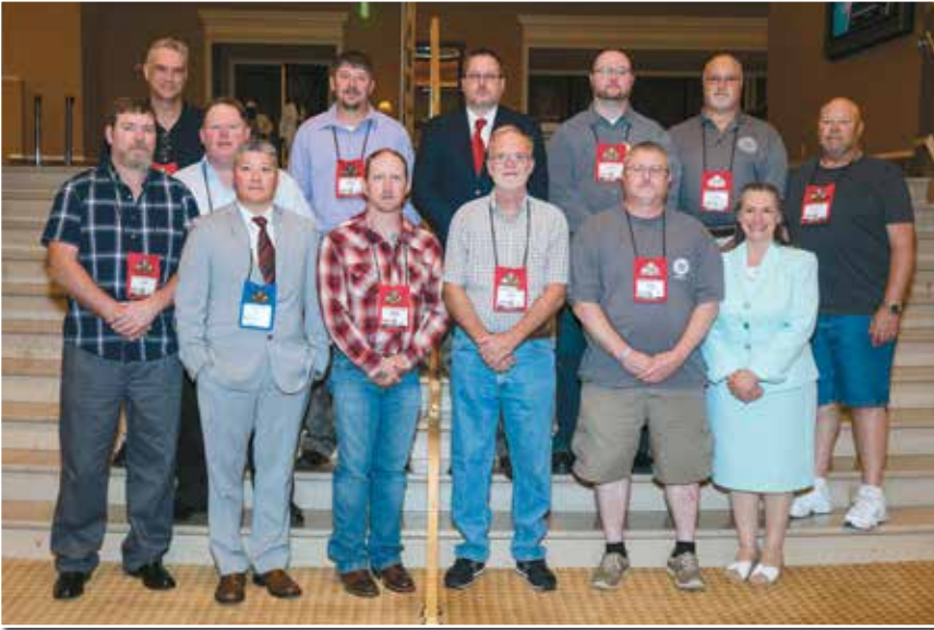
CAUCUS SOBRE INDUSTRIA FERROVIARIA