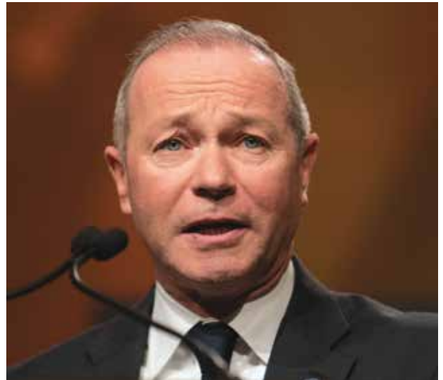
ROBBIE HUNTER Presidente del Consejo Estatal de los Oficios de la Edificación y Construcción de California