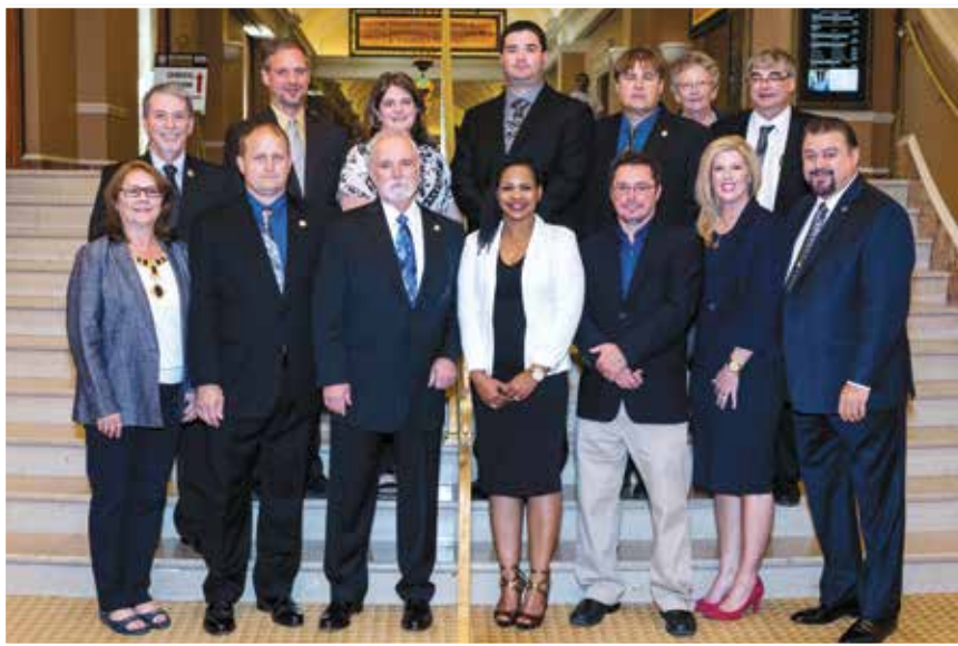
COMITÉ DE FINANZAS