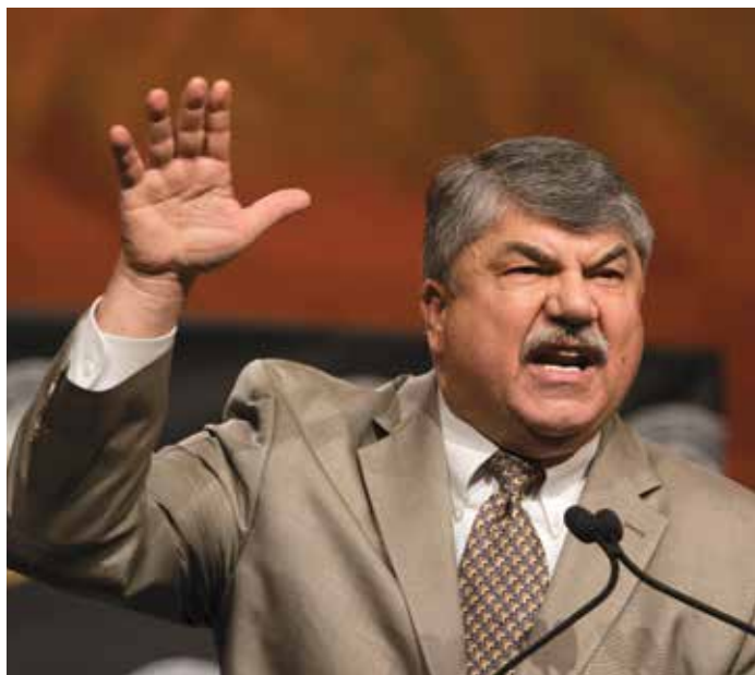
RICHARD TRUMKA Presidente de la AFL-CIO

“Ellos nos dicen que Estados Unidos es una nación del pueblo, por el pueblo y para el pueblo”, dijo Roberts. “Les aseguro... es del dinero, por el dinero y para el dinero.”