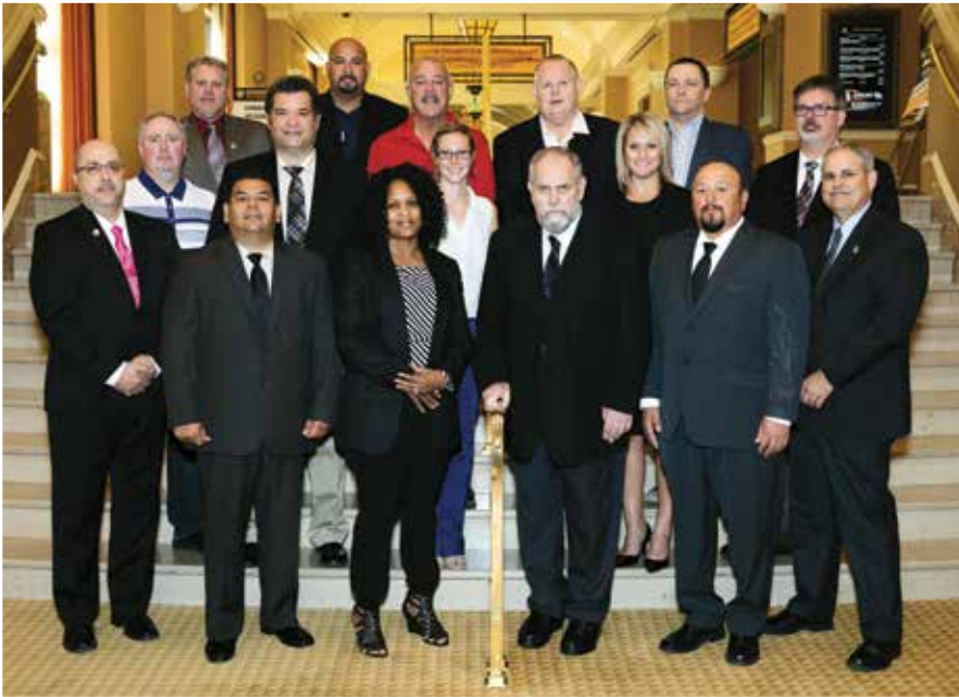
COMITÉ DE DISTRIBUCIÓN