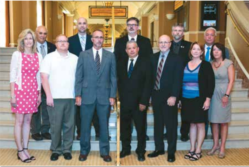
COMITÉ DE PUBLICACIÓN OFICIAL